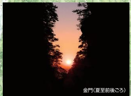
金門(夏至前後ごろ)

「博労」とは牛馬の売買や仲介を仕事とする人のこと。約300年前、大山の祭日を期して開かれた市を起源とし、「日本三大牛馬市」のひとつとしてあった牛馬市の会場で、今はバスの停留所、一般駐車場、イベント会場となっています。 平成28年4月25日、「地藏信仰が育んだ日本最大の大山牛馬市」が日本遺産に認定されました。